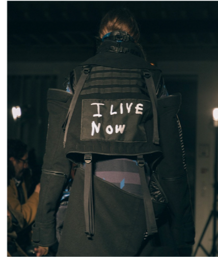
「TAKAHIROMIYASHITA TheSoloist」 2019年秋冬コレクション 2019.01