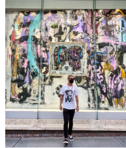
渋谷西武 ショーウィンドウデザイン 2021.06